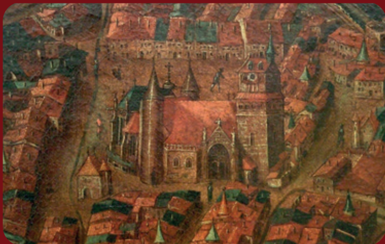
Extrait du plan topographique de la ville d'Épinal en 1626