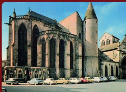
Place Edmond Henry, vers 1970