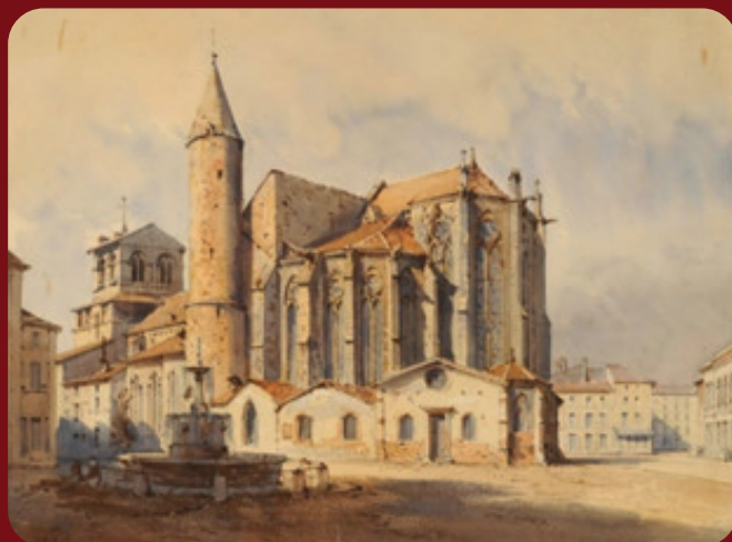
Place de l'Âtre, vers 1830