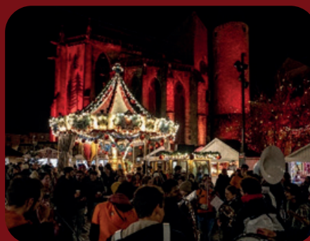
Marché de Noël, 2024