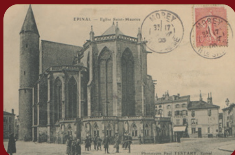
Jeu du cerceau, vers 1900