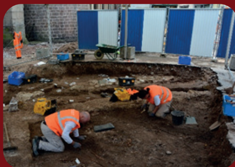
Fouilles archéologiques, 2019