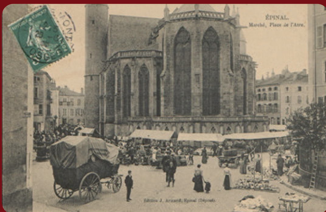
Le marché, vers 1900