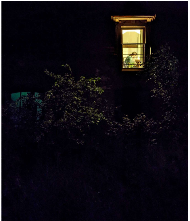
Un atelier d'artiste la nuit au Tournefou.